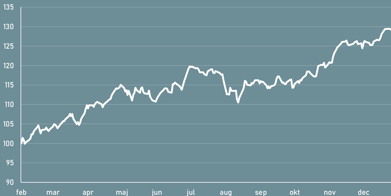
Avkastning för andelsklass A